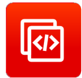
增强型 AT 命令集